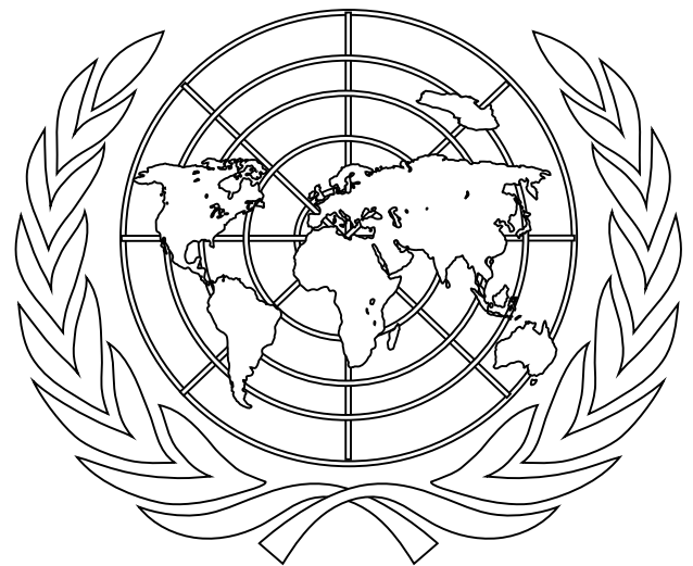
(Il simbolo dell'ONU).